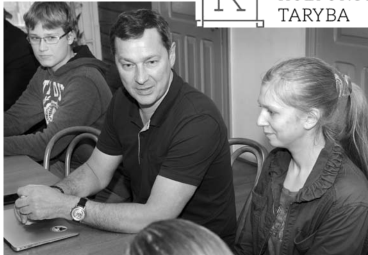
Pamokose moksleiviai turi galimybę susitikti su žymiais žmonėmis. Vienoje iš pamokėlių su mokiniais bendravo žurnalistas pagal išsilavinimą, Anykščių rajone gyvenęs buvęs Vilniaus meras Artūras Zuokas.