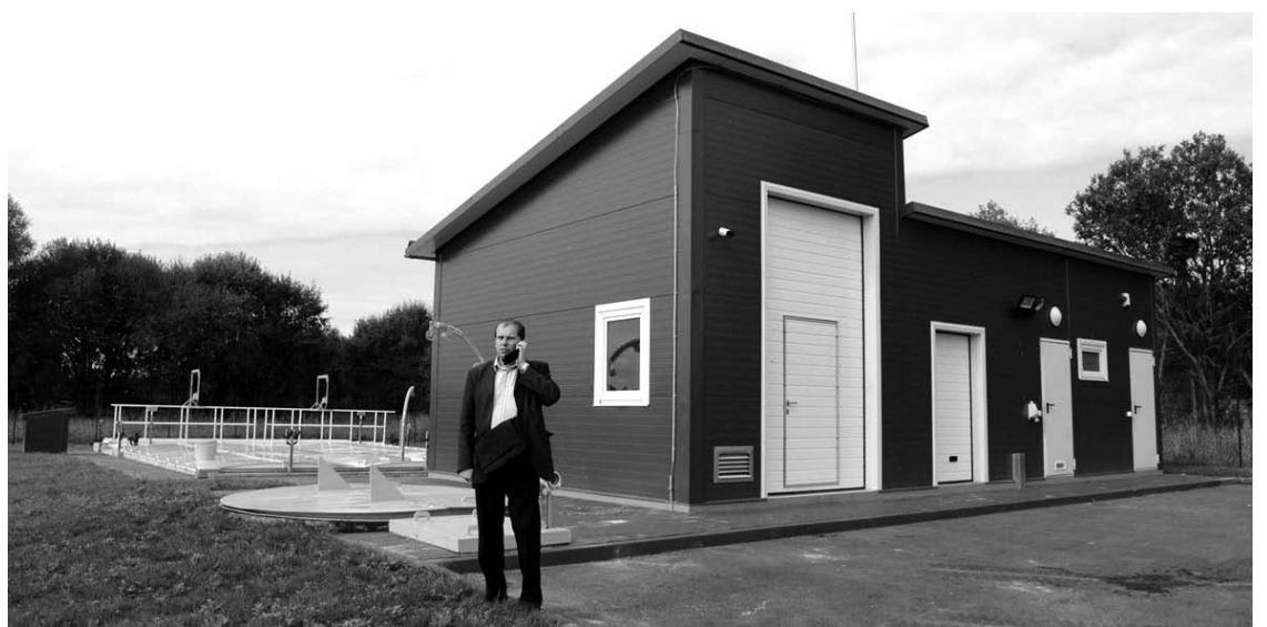
Šiame namelyje yra visa automatinė nuotekų valymo įrenginių valdymo ir duomenų perdavimo sistema, buitinės patalpos.