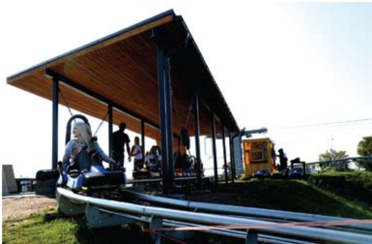
Vasaros rogutės populiarumo nepraranda.