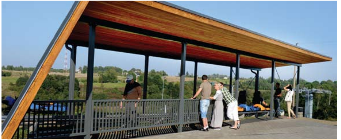
Darbuotojų ir kalno lankytojų patogumui – trinkelėmis grįsta vasaros rogučių įlaipinimo – išlaipinimo aikštelė ir stoginė virš jos.

lis, nereikės jų taip dažnai valyti“. Įlaipinimo – išlaipinimo aikštelė išklota trinkelėmis. Tai irgi didelis patogumas, nes visai neseniai palijus norintys pasivažinėti į rogutes po lietaus lipdavo purviniais batais. Rogutes tekdavo dažnai valyti. Direktorius sakė, kad dėl didelio lankytojų srauto centras dar tiksliai nesuskaičiavęs šio, dar tebesitęsiančio, sezono rezultatų, tačiau teigė, kad liepos ir rugpjūčio mėnesiais rogutėmis važiuo pusantrą karto daugiau žmonių negu pernai per tuos pačius mėnesius.